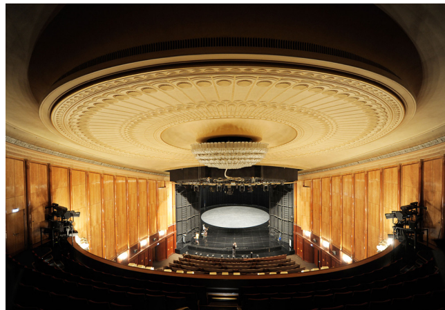
Lidová scéna Berlín, pohled k jevišti, stav 2014,

Lidová scéna byla v letech 2009 až 2012 rekonstruována a přestavěna podle památkářských požadavků studiem architektů AGP.