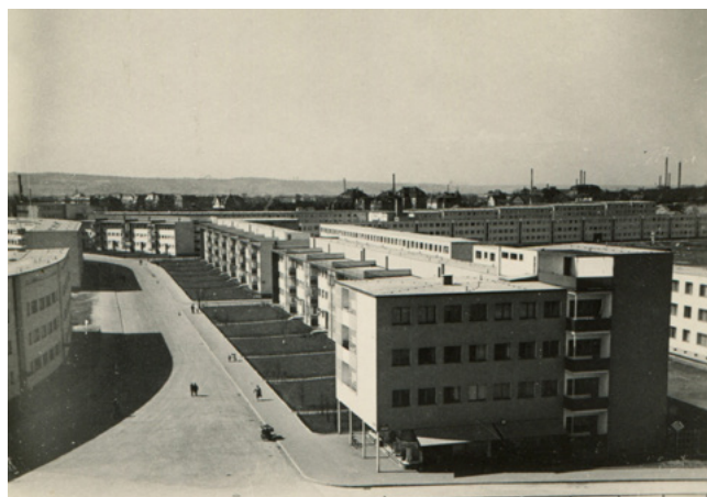
Sídliště Trachau, pohled do Kopernikusstraße, 30. léta, SMD/Ph/2003/06884