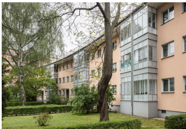
Sídliště Trachau, Kopernikusstraße, pohled ze zahrady, 2019, Foto: Till Schuster