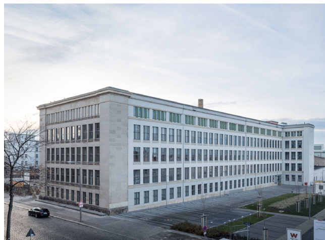
Továrna Universelle, bývalý správní trakt, 2020, foto: Till Schuster

Při náletech v roce 1945 byla firma Universelle těžce zasažena a od roku 1946 postavena znovu se změnami. Po roce 2010 byla zahájena rekonstrukce budovy, která má být ukončena v roce 2022. Dnes prostory provozuje firma TechnologieZentrumDresden GmbH, hlavní nájemci jsou mimo jiné Německé středisko pro letectví a kosmonautiku, Technická univerzita Drážďany a z TU Drážďany vzešlý startup Anvajo GmbH.